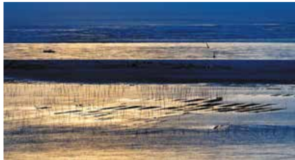
▷ Les parcs à huîtres du banc.

Quarante-cinq hectares de parcs à huîtres sont installés à proximité du banc d'Arguin. Les ostréiculteurs s'y sont installés dans les années 1980, parce que la croissance des huîtres était ralentie dans le Bassin. Ici, au contraire, elles trouvaient un terroir idéal. Ces parcs ont la particularité d'être déplacés au gré des migrations naturelles des herbiers de zostères.